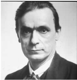
Dr. Rudolf Steiner